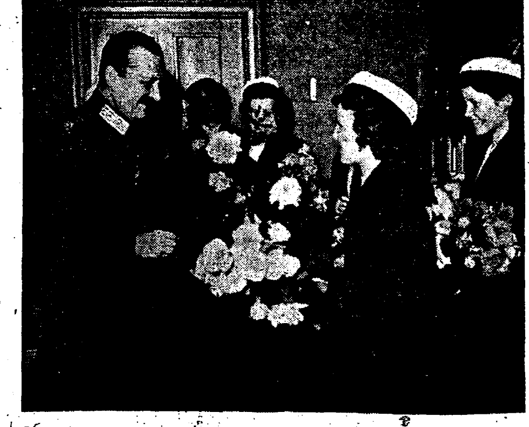
De mooiste rozen voor den generaal-velddmaarschalk. — In Finland is het gewoonte dat de meisjes die eindzamen gedaan hebben, na afloop van haar leerdijk rozen ontvingen. Deze keer brachten de meisjes de mooiste exemplaren naar generaal-velddmaarschalk Mannerheim, terwyl zij met de overige de heidengraven, versierden van de gevallen landgenooten.