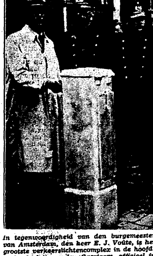
In tegenwoordigheid van den burgemeester van Amsterdam, de heer E. J. Volla, is het grootste verkeerlichtcomplex in de hoofdstad, nl. dat van den Overtoom, officieel in gebruik genomen. De burgemeester stelt de verkeerslichten in werking door het omroepen van een knop.