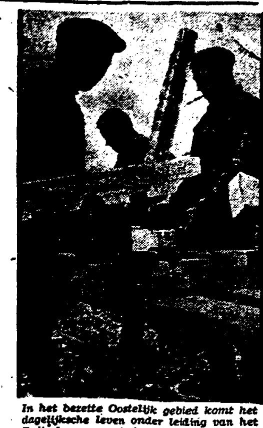
In het Duitse Oostelijk gebied komt het dagelijkse leven onder leiding van het Duitse economische commando weder op gang. De snijsetbevoegdheid wordt aan den arbeid gezet om met haar primitieve gereedschappen verschillende werktuigen te vervaardigen. (Deutscher Verlag-Recla-p.k. Menzendorf-Pax-Holland-c.)