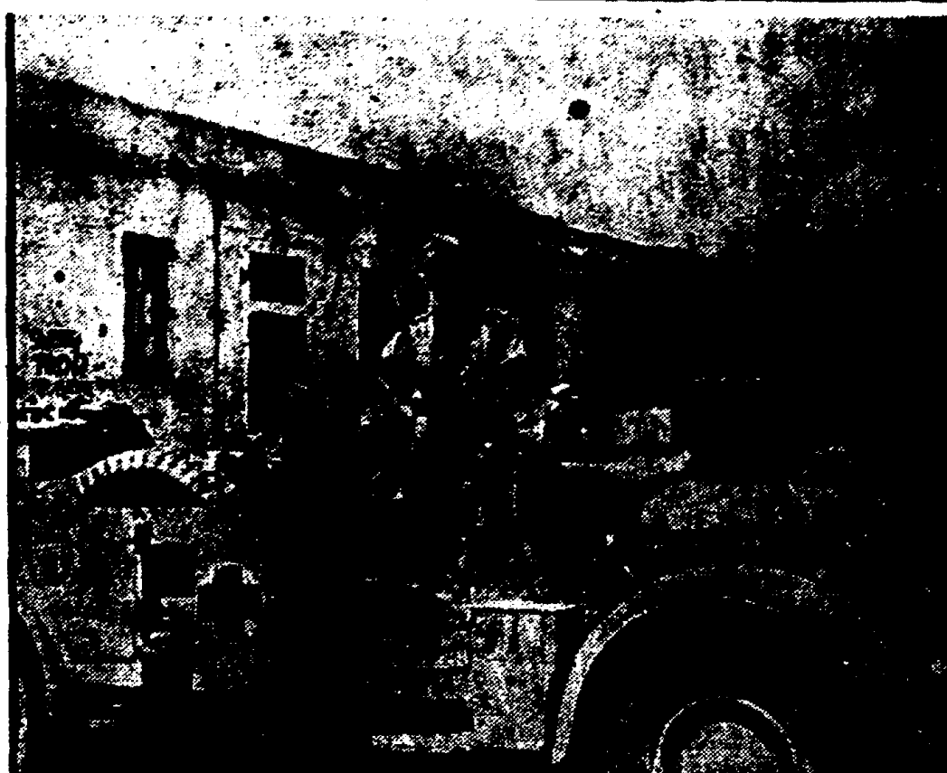
De eerste Duitse PKW's zijn Tobroek binnengekomen en parkeren op het hoofdplein van de stad. Bijna ieder huis vertoont de sporen van den strijd.