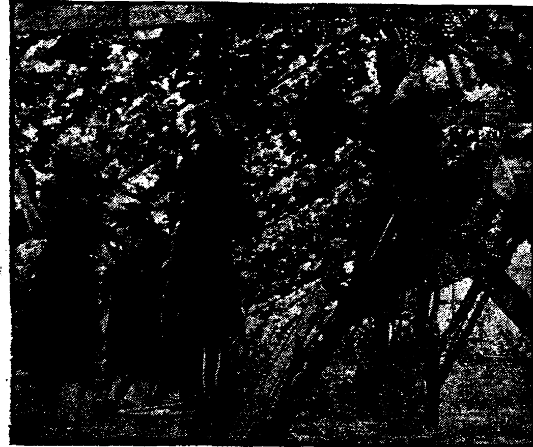
Bij het drubben krenten in het Westland komt men handen tekort. De meisjes van den Nederlandschen Arbeidsdienst uit de kadertschool te Wassenaar zijn, toen haar het verzoek werd gedaan, bereidwillig een handje komen helpen.