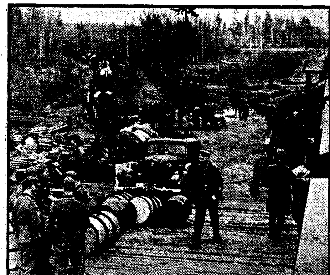
Bij de Nederlandse vrijwilligers aan het Oostelijk front. — Een goederentrein met versche voorraden is zojuist aangekomen. Bij de uitlaadplaatsen staan de wagens gereed.