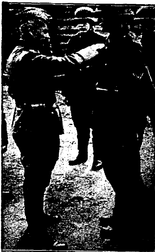
Bij het Nederlandse leger aan het Oostelijk front. — Eenige soldaten krijgen het Nieuwe Kruis.