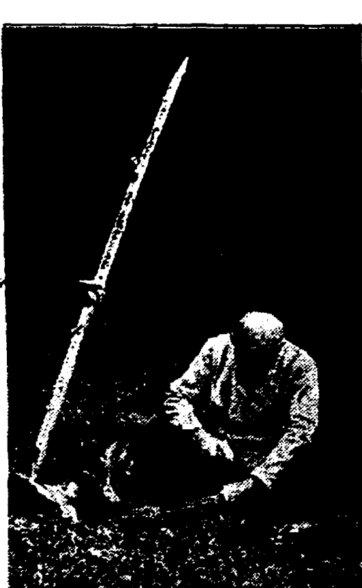
Zomer op het land. — De maaiër scherp zijn zels. (Pax-Holland-o. Bemmel-n.)