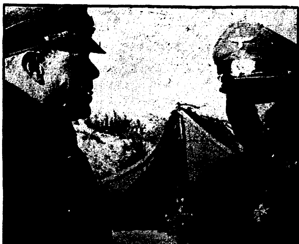
Rommel en Kesselring, de overwinnaars van den Tobroek-slag. — De voorreffelijke samenwerking van het pantserkorps onder leiding van generaal-velddmaarschalk Rommel en van het luchtkorps onder leiding van generaal Kesselring, maakte het succes mogelijk.